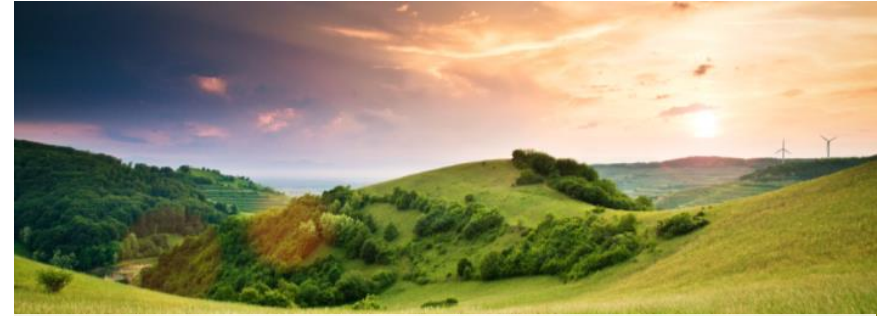
Klimawandel und Ressourcenknappheit