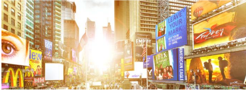
Demografischer und sozialer Wandel